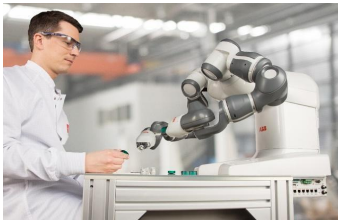
图 2 双臂协作机器人 YuMi

ABB 公司也有一款双臂协作型机器人,名叫 YuMi。作为一款人性化设计的双臂机器人, YuMi 使小件装配等自动化作业进入一个全新时代。工人和机器人可以和谐共处,共同完成同一个任务如图 2 所示。YuMi 在英文中是“你和我”协同工作的简称。这样的协作系统让机器人完成制造任务中那些繁琐的重复动作,而让专业人员专注于核心需求。