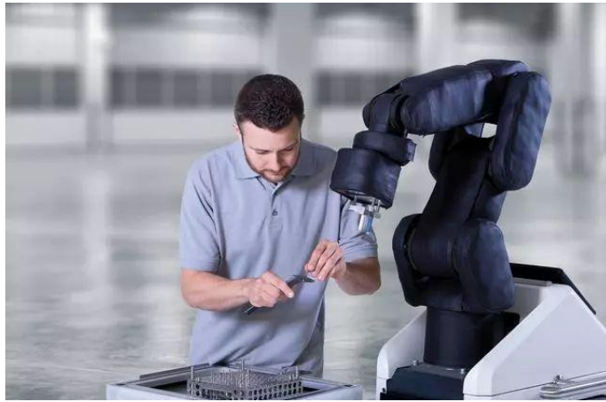
图 1 协作机器人 APAS

时,这些传感器能够检测到接触产生的非常规力,并给控制器提供一个即时反馈。同时,机器人还有安全距离保护,当检测到人靠得太近时,也会自动降低运行速度;在人离开该区域后,机器人会自动恢复正常速度,相当于隐形的防护网。