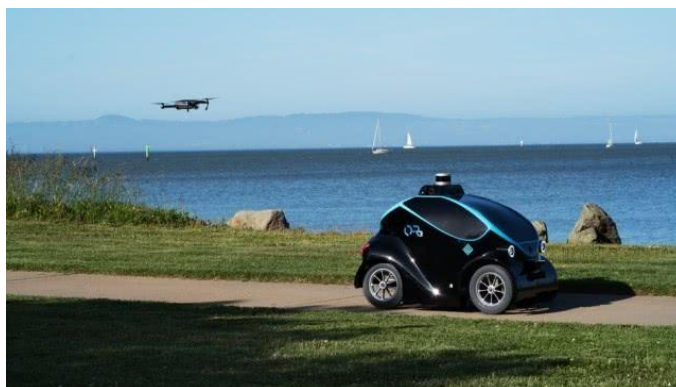
图 4 地空协同安保机器人

无人机和地面移动机器人配合，可以扩展机器人对环境感知的能力，提高机器人工作效率，见图 4。